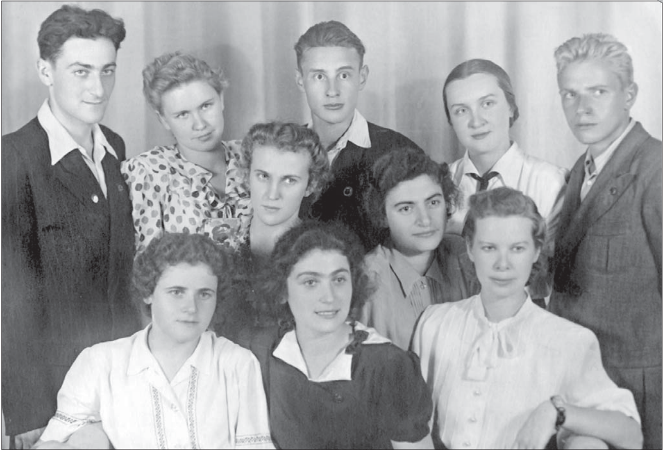
Выпускники филологического факультета МГУ. 1952 г.