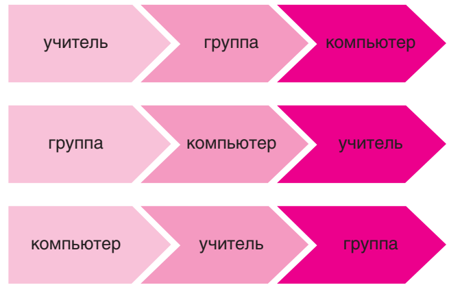
Схема 2. Варианты путевых листов микрогрупп

русскоязычную версию как средство иноязычного образования?